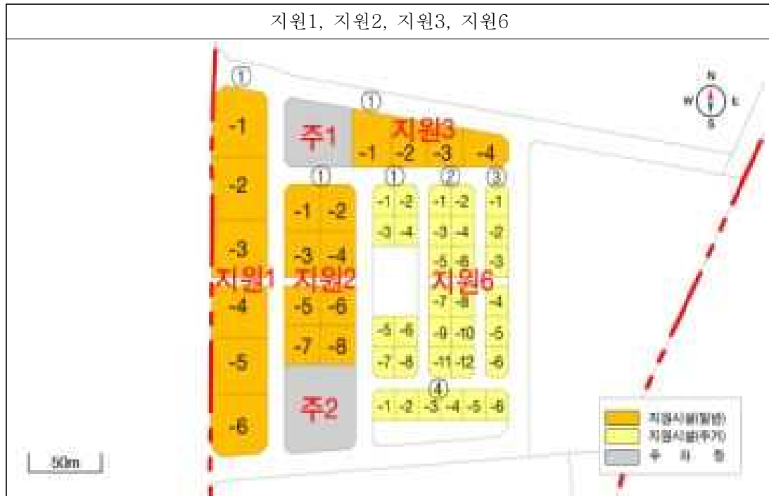
[별표 1 : 지원시설구역 계획도]